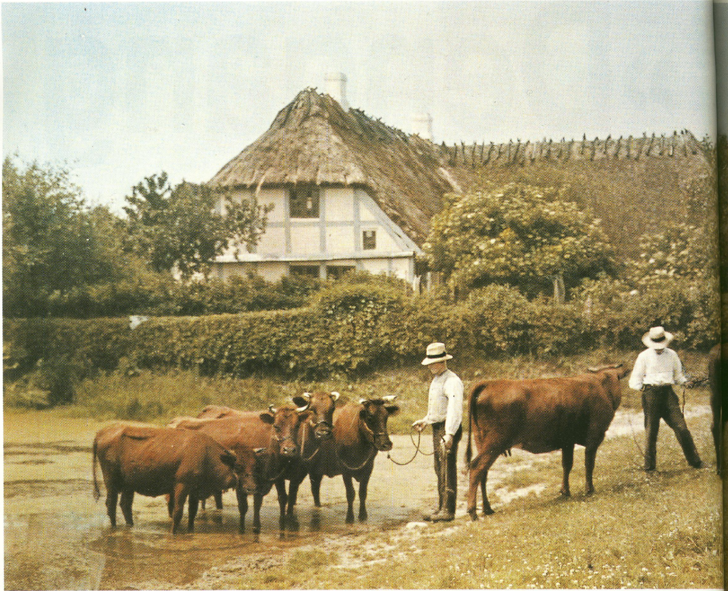
Køerne ved vandingsstedet – den lange eksponeringstid giver billedet en drømmeagtig landidyl. Solen brænder og luften står stille.